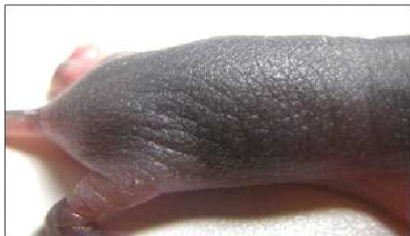
ma ( ft + · ma / ft + · ma )

(写真2) C57BL6/J、flaky tail ( ft · ma / ft · ma )と ma ( ft + · ma / ft + · ma )マウス生後6-7日目の表現型。flaky tail は背部皮膚のシワが顕著である。