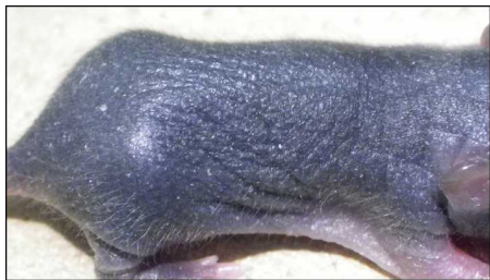
flaky tail ( ft · ma / ft · ma )