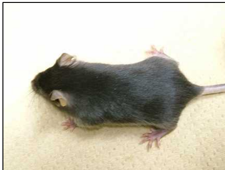
ft^- \cdot ma^+ / ft^- \cdot ma^-