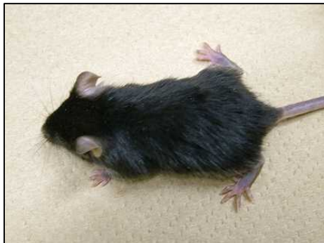
ft^- \cdot ma^- / ft^- \cdot ma^- (=flaky tail)

ft 及び ma の表現型と遺伝子マーカー解析により、 spa ・ ma もしくは ma ・ ft 間で相同性組換えをおこした個体を抽出し、さらにそれらの spa ・ ft 間の相同性組換え領域を確立したDNA多型マーカーで同定する事により、 ma 責任領域を狭めていく。