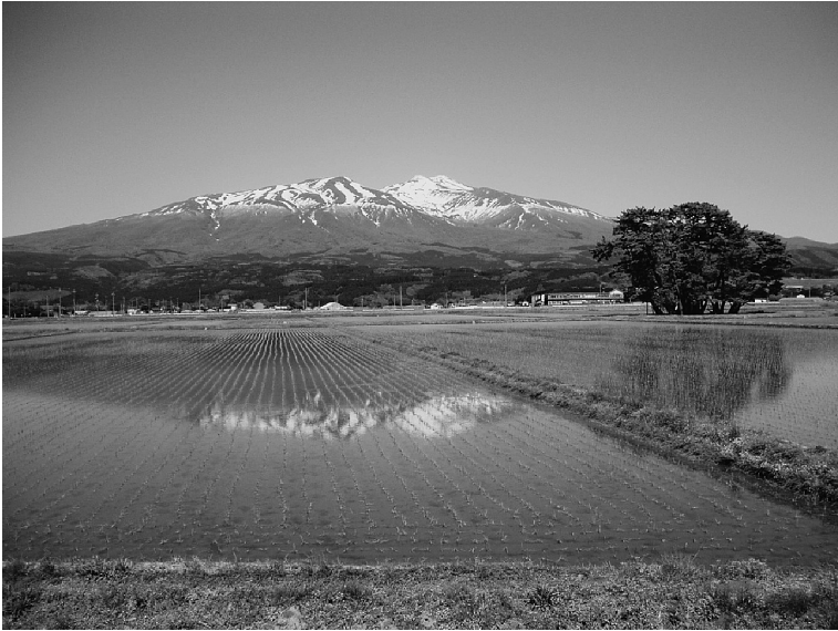
図1. 遊佐町から望む初春の鳥海山

字七曲堰ノ東)など歴史上の重要な地点が集中しており、古い生活と信仰の場所であった可能性が高い。豊富な湧水と清冽な透明度で知られる牛渡川はすぐそばを流れ、秋になると鮭が産卵のために遡上する 3 。月光川、高瀬川、日向川など鳥海山に源流を持つ川は鮭川でもあった [鈴木2006]。鮭は悪天候時にも沢山遡上し、飢饉時には救荒食糧ともなる重要な蛋白源で、庄内ではヨオと呼ばれ魚類の代表とされていた。伏流水は海岸部の釜磯、女鹿、滝の浦に「海底湧水」として豊富に湧き出し、海水と微妙に混ざり合って、岩牡蠣 いわがき が生育するなど海の幸にも恵まれている 4 。鳥海山は自然の豊かな恵みをもたらし、水が山岳信仰の中核にあった。鳥