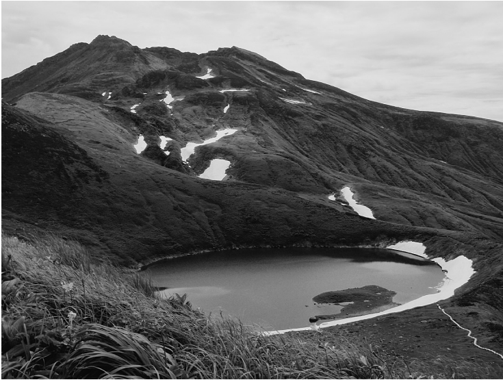
図3. 鳥の海から鳥海山の山頂を望む