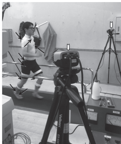
図 3 計測法の実際 (予備実験時)

被検者に本 WS を装着してもらい、同時に皮膚に赤外線反射マーカを貼付して 3 次元動作解析を行った (図 3)。直径 8 mm の spherical marker を頭部では頭頂部、側頭部および後頭部に貼付した (被験者の頭部に swimming cap をかぶせて、その上にマーカを貼付した)。また、マーカを肩峰、第 7 頸椎棘突起部、第 10 胸椎棘突起部、肩甲骨内側縁、腸骨稜、後上腸骨棘、大腿骨大転子、大腿後外側、膝関節外側、下腿外側、足関節外果、第 5 中足骨頭および基部、踵骨隆起部に貼付した。またマーカを WS の耳かけの部分にも貼付し、このマーカの動きをリファレンスとして WS と MC のデータの同期を行った。