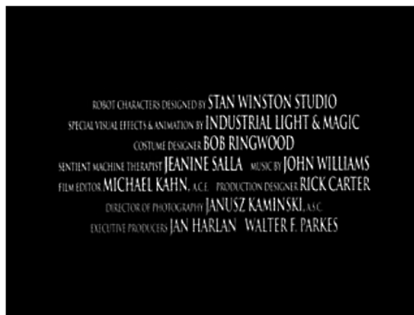
図2 映画 A.I. の予告編に現れる Jeanine Salla という謎の人物名 (Dreamworks 2001)

この映画に先立ってインターネット上に予告編のビデオ映像が公開されたが、そのクレジット中に表れる、“Jeanine Salla, Sentient Machine Therapist” という、一見意味不明な職業名と人物名がこのゲームを開始するきっかけとなる。しかし、これがゲームに関するものであることは当時誰にも知らされておらず、そのため、その人物名