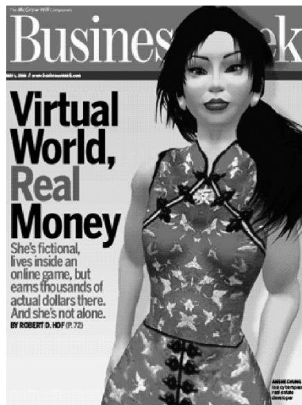
図1 セカンドライフ内のミリオネア

大手企業の取り組みが話題となる傾向が強いが、セカンドライフのユニークな特徴は、一定のスキルのある利用者であれば、誰もが自由にアイテムや建物などを作り出せるという点にあり、セカンドライフ内で制作したコンテンツの著作権は、すべて制作者に帰属するようになっている。実際、外観やアバターの操作などは、ネットワーク上のオンライン3Dゲームに類似しているものの、ワールドを構成するコンテンツのほとんどがユーザーによって制作されたものである。また、セカンドライフ内のコミュニケーションは、同じ土地の場所に同じ時間に居合わせ、視覚的に互いのアバターの存在や振る舞いを確認しつつ行われるのが一般的である。そのため、ブログやソーシャルネットワークサービスなどの非同期的なWebサイト上のコミュニケーションと比較して、セカンドライフ内のコミュニケーションには、ライブ感や臨場感がより