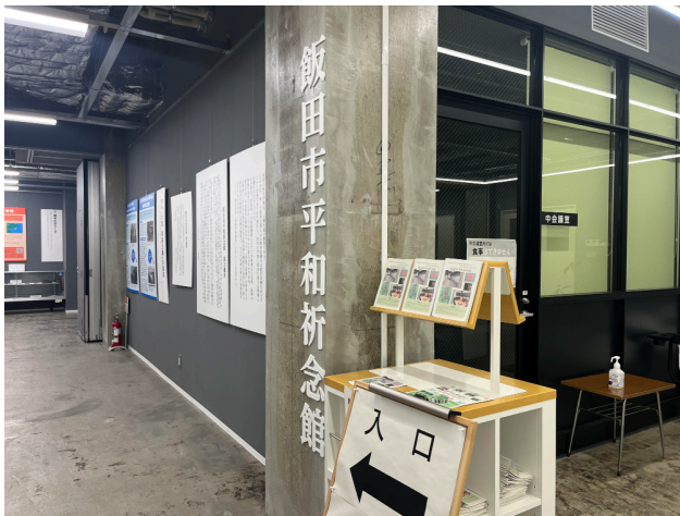
図6 飯田市平和祈念館

初日の午後は、2022年5月にオープンした飯田市平和祈念館を訪問した。飯田市平和祈念館は、飯田駅前の「丘の上結いスクエア」の3階「ムトスぷらざ」の一角にあり、同階の飯田駅前図書館やシェアスペースでは、幅広い年齢層の人々が思い思いに過ごしており、地域の交流の拠点となっている様子がうかがえた。今回の訪問では、市民団体である「平和祈念館を考える会」等で活動する3名とお会いし、飯田市平和祈念館設立までの歴史や、現在の平和祈念館をめぐる状況について話を伺った。