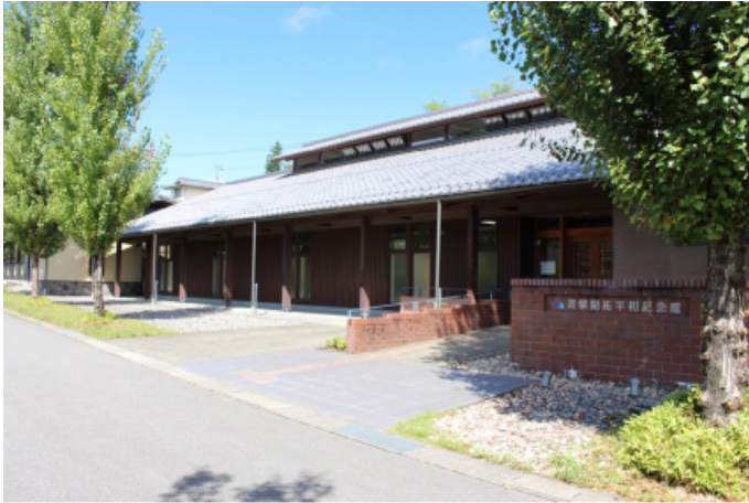
撮影日：2023年9月9日