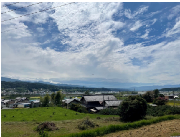
図5 山吹駅近くから見た伊那谷。天竜川の対岸に豊丘村を望むことができる