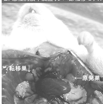
ヒト悪性胸膜中皮腫リンパ節転移モデル

NOG マウスの左胸腔内にヒト悪性胸膜中皮腫細胞株 ACC-MESO-1 細胞 5 \times 10^6 個を注入し、1 ヶ月後に左胸膜腫瘍と縦隔リンパ節および対側胸膜転移を生じるモデルを開発した。