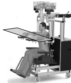
図1 実験装置 (KINARM)

実施した。粘性力場とは、被験者が KINARM のバーチャルリアリティ・ディスプレイ上に呈示されたターゲットまで、手先位置に呈示されるカーソルを到達させる際、手先に対してカーソル速度に直交する外力が与えられる環境である。本研究では、時計回り(CW)または、反時計回り(CCW)力場の2条件で実験をおこなった。両条件において、被験者は初めに力場環境下で450回の右腕(訓練肢)による到達運動訓練をおこない、うち75回は力場適応に伴って発揮される力を計測するための評価トライアルとした。評価トライアルでは、エラークランプと呼ばれる手法を用いて運動をターゲット方向に拘束し、手先の変位を矯正するためにロボットが発揮した力から、手先が発揮した力を逆算して計測した。力場適応後に、左腕(非訓練肢)を用いて、エラークランプ内で両腕間転移によって発揮される力を計測するための評価トライアルを75回おこなった。