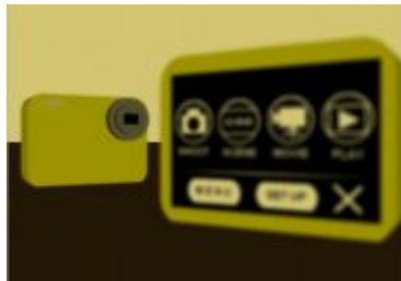
(b)高齢者視覚シミュレーション映像 (70歳・正視)