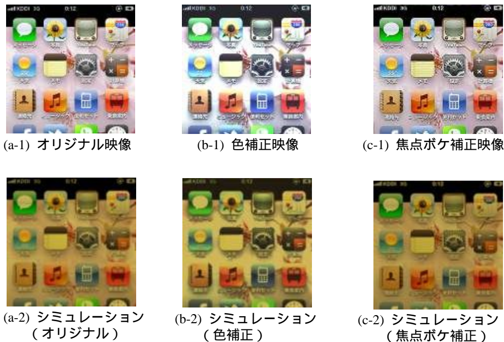
図4 デザイン補正結果

に対し補正後は 3.2 点と補正効果を確認できた。また、焦点ボケに関するデザイン補正の評価実験として、60, 70, 80, 90 歳の補正映像とオリジナル映像の各年齢の視覚シミュレーション結果を提示した。20 代の学生 15 人のうち補正映像の方が見やすいとした回答率が 73% 以上となり補正効果を確認した。さらに高齢者 2 名(76 歳, 79 歳)に色補正, 焦点ボケ補正, 両方の補正映像とオリジナル映像を見せ, どちらが見やすいか回答してもらったところ, 正答率は平均 72% となり補正効果を確認した。