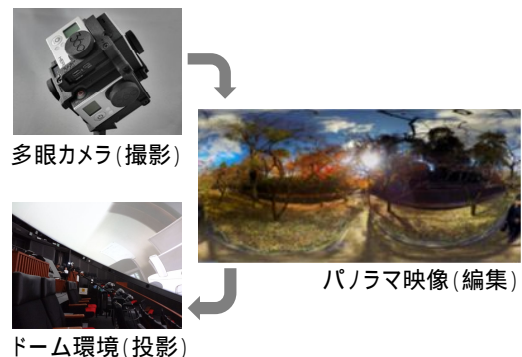
図1 ドーム映像制作手法の流れ

ドーム環境は、システムによってプロジェクタの構成が異なるが、この方法では、ドーム環境の構成に依存せず、コンテンツを独立した形で制作することが可能である。図1は以上のドーム映像制作手法のフレームワークの流れを図示したものである。