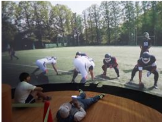
図5 中型ドームでのアメリカンフットボール映像