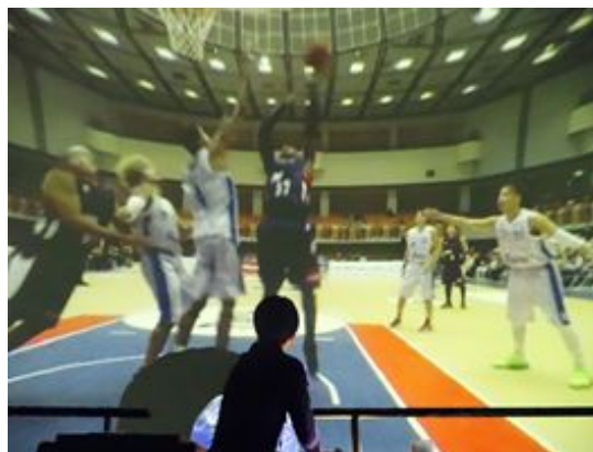
図4 大型ドームでのバスケットボール映像

本研究では、上記の方法を用い、実際に幾つかのドームコンテンツの制作を行った。コンテンツとしては、スポーツ、旅行、イベント等である。図4、図5は、異なるドーム環境で幾つかのコンテンツを提示している様子を示したものである。