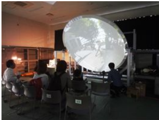
図6 埼玉県総合教育センターでの評価実験の様子

この結果から、立体感、臨場感、映像への集中度、興奮度等の項目では高い評価が得られ、ドームコンテンツ制作手法としての有効性を確認することができた。