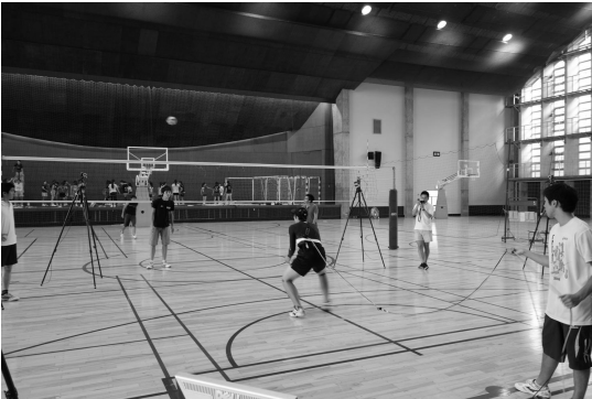
図2：バレーボールのサーブレシーブ