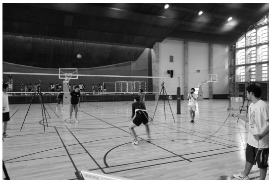
図2：バレーボールのサーブレシーブ