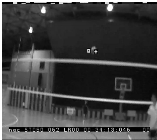
図5：ネット上のボールとレシーバーの視線

シーブを取り上げてみると、熟練したレシーバーはフローターサーブと呼ばれる無回転で不規則な軌道を描くボールに対した場合でも、視線の移動は比較的小さく、身体位置の初動は比較的迅速で、ボール落下位置へのポジショニングを正確に行っていることが明らかとなった。さらにボールがネット上に達するまでは追従するための視線移動方略を取り(図5) ネット上に達してからは徐々に視線をボール位置から外して移動させ、周辺視機能を活用して最終的な動作としてのレシーブを行っていた。つまりレシーブ前半にはボール位置予測のために知覚を主とした振る舞いが見られ、後半では確実なレシーブ動作の遂行のための運動を主とした振る舞いが見られたことが示唆された。