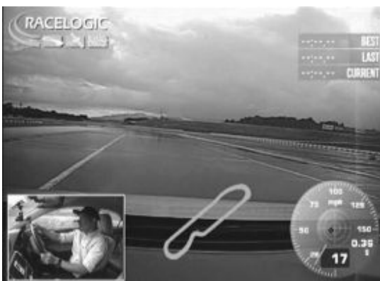
図3：モータースポーツ走行