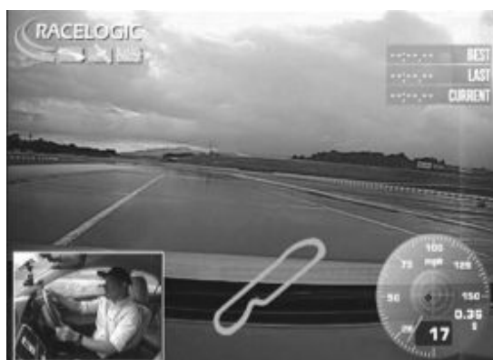
図3：モータースポーツ走行