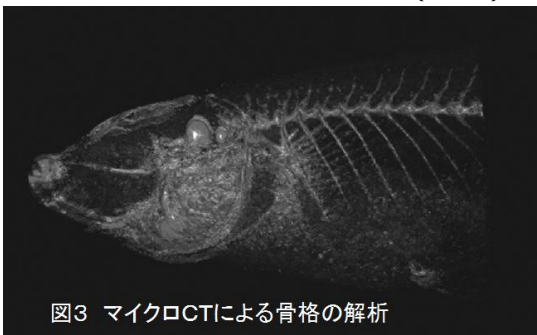
図3 マイクロCTによる骨格の解析

(5) Fra-1 のメダカ骨格形態への影響の解析するために、Fra-1 メダカを Alizarin complexone を用いて生体染色したところ、骨格形態の異常はなく、石灰化が低下していた。このことは、マウスでの石灰化低下の現象と矛盾しない。さらに、小動物用マイクロ CT 装置により、骨格形態には異常がなく、石灰化が低下していることを確認した(図3)。