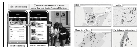
図1(左)ユビキタス体験教育環境を外国語学習へ適用し、時空間的関連性に応じた教材情報配信を実現、図2(右)世界各地に外国語教材を1,000件以上設置し、グローバルな外国語学習環境を構築

外国語学習の電子教材を対象として、このシステムを適用することにより、日常的、恒常的かつ継続的な学習を、学習者の日々の実体験と連動させながら、学生生活の中に組み込む授業を実施する計画であった(図1,図2)。さらに、研究代表者らが所属する慶應義塾大学SFCを拠点として、本教育システム環境を広く公開し、生活に密着した学習のためのシステム基盤を他分野に展開する見通しを立てた。また、本研究により実現される情報配信は、地理的・時間的に大きく隔てられた諸国間の協調作業を促進するため、国際的な学術情報の共有・配信システムとして展開可能である。上記4共同研究拠点に加え、国際的実用環境の構築および共同研究を遂行するために、ヨーロッパにおいては実証実験の対象として教材を配置したドイツ州立ハレ・ヴィッテンベルク大学、ドレスデン工科大学、ボン大学、ミュンヘン大学、WHU 大学との連携を進める。これらの大学とは既に交換協定を締結し、特に前者2大学とは2006年度より遠隔会議システムを使った合同授業を毎学期継続して開講しており、本システム環境の継続的な発展を計画した。