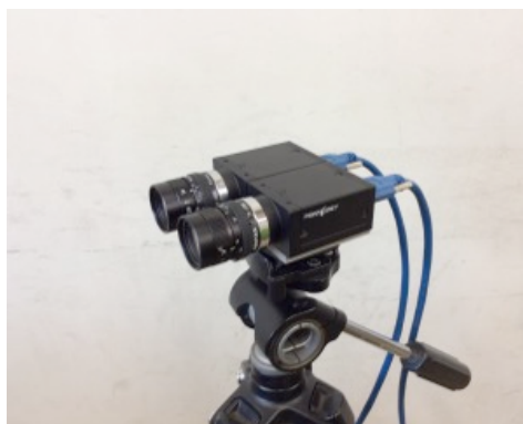
図3 ステレオカメラ

視覚伝送装置は、カメラを接続した撮像側とディスプレイモニタを接続した再生側の2台のコンピュータシステムで構成し、互いを1Gbpsのイーサネット接続した。基本通信プロトコルとしてはUDPを採用し、画像圧縮とパケットのパッキングに対しては四分木構造のブロック分割法を適用することで、通信による再生遅延の低減を行った。視覚情報を取得するためのカメラには図3に示す2台のUSB 3.0接続のビデオカメラを組み合わせたステレオカメラを、視覚情報の提示するためのモニタには3Dメガネによる立体視が可能な3Dモニタを使用し、視覚映像の伝送を可能にした。