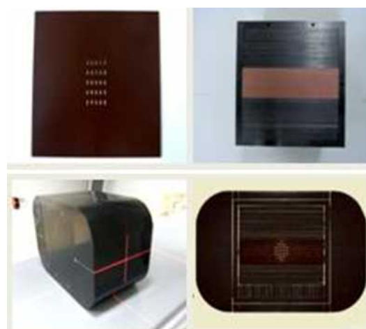
図 2 作成した水等価性ファントムシード線源が留置できるように加工した。