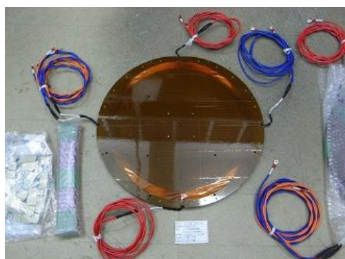
図3 製作した勾配磁場コイルの概観

製作した勾配磁場コイルを図3に示す。GX,GY,GZ コイルで構成され、1 G/cm の勾配磁場を形成することができる。各コイルの抵抗値は 0.5\Omega であった。MRI 計測によって最大電流が印加された場合の発熱量はおおよそ50W程度と見積もられる。