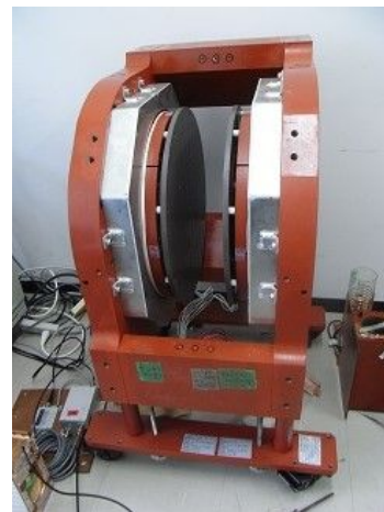
図2 製作した磁石の概観

製作した磁石を図2に示す。磁場強度0.3 Tesla、磁石間ギャップは140mm、計測領域(MRI計測が可能な均一磁場領域)は70mmである。この磁石には冷媒を循環することができるように工夫されている。この小型永久磁石が慶大小川研究室に設置された。