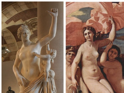
図 1 ウェヌスとクピド プッサン《ネプトゥヌスの勝利》部分 1634