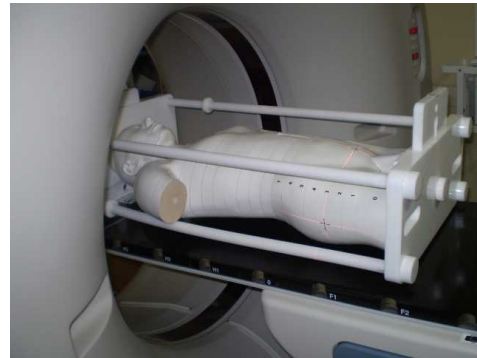
（図4）ファントムのX線コンピュータ断層画像撮影