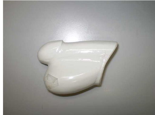
（図3）精巣ファントム