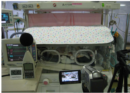
低照度環境 (上) 照度計 (右)

低照度とは、保育器を遮光カバーで覆った環境であり、平均照度は 28.6 ルクス (20 ~ 38) であった。一方、通常処置時照度とは室内の照明をすべて点けた状態であり平均照度は 1432 ルクス (1202 ~ 1655) であった。