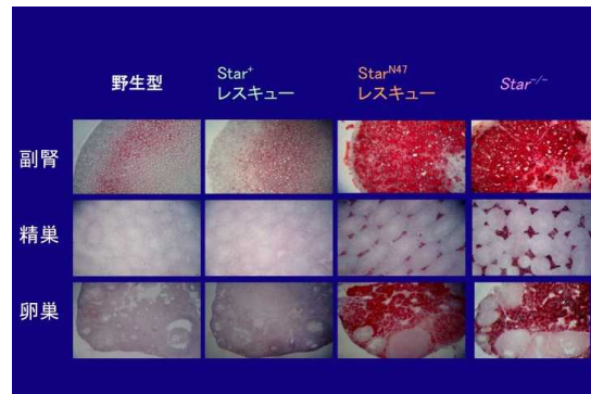
(図3) 月齢2の各遺伝子型マウスの副腎, 精巣, 卵巣ステロイドホルモン産生細胞細胞質への脂肪滴蓄積(オイルレッド-O染色).

本研究の結果, Star N47 によるミトコンドリア標的シグナル非依存性のコレステロール転送能は Star -/- マウスの表現型を完全には救済できなかった. ミトコンドリア標的シグナルを利用した StAR 蛋白自身のミトコンドリアマトリックスへの移動が, in vivo における Star のコレステロール転送能に重要な役割を果たすことが初めて明らかとなった.