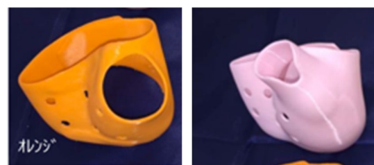
図 4 2タイプの 3D プリンティング装具。MP 関節を固定しないショートタイプ（左）と MP 関節を固定範囲に含めるロングタイプ（右）