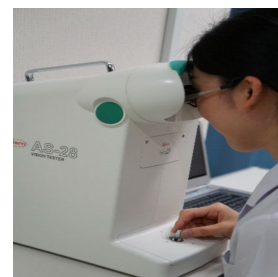
図3: 実用視力計: 患者はモニターに表示された視標に応じてジョイスティックを動かして回答する。一定時間連続して施行する視力検査

以上より、筆者らの前年度までの研究で実用視力は安全運転のための重要な視覚機能、認知機能(有効視野)運動機能(反応時間)の3要素を同時にスクリーニング可能な、運転適性のスクリーニ