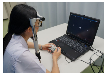
図2: 抑制課題付有効視野測定法・高齢者版(VFIT-EV)

藤田らは、省スペースで身体機能や言語機能などの影響を受けにくい抑制課題付有効視野測定法(Visual Field with Inhibitory Tasks; 以下VFIT)の課題難易度を高齢者用に調整した高齢者版(Elderly Version; 以下、EV)を開発し、高齢運転者においてVFIT-EVの正解率と実車評価の間に相関がみられたことから、VFIT-EVが高齢者の運転適性の指標として有効であると報告している(藤田佳男