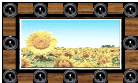
図 3 トランスオーラルシステムのためのスピーカ構成