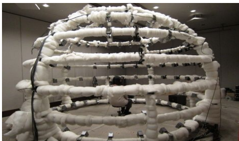
図 2 頭部伝達関数の同定実験環境 (NHK 放送技術研究所)