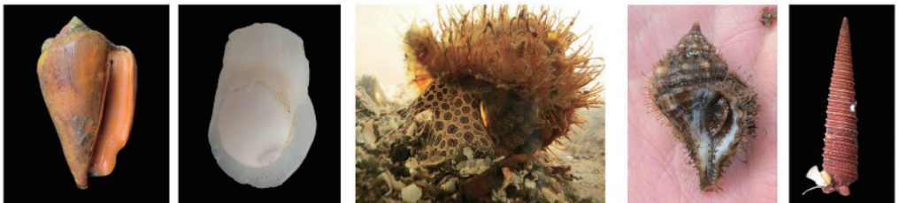
マガキガイ (72) トミガイ (83) カコボラ (89) ククリボラ (90) キリオレ (94)