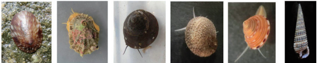
サクラアオガイ (17) クズヤガイ (21) バテイラ (22) アシヤガイ (25) エビスガイ (32) カニモリガイ (42)