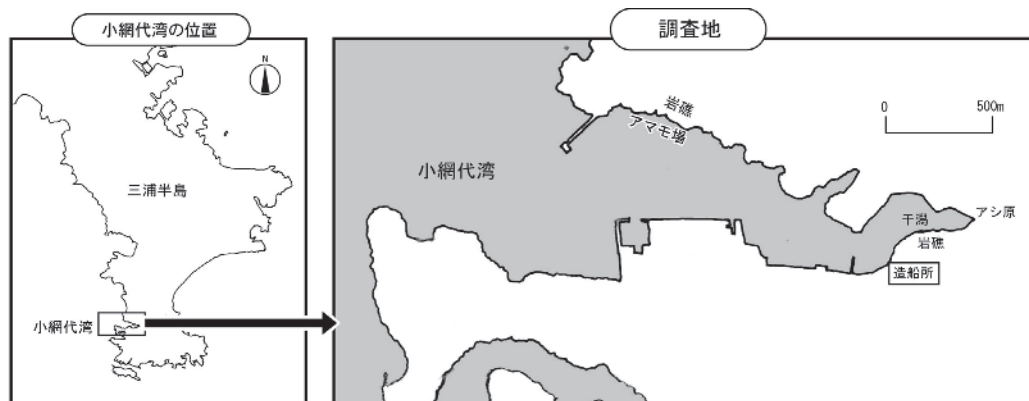
図1. 小網代湾の位置と調査地

するものである。小網代湾の海産貝類についての過去の報告としては、岸ほか（1994）において42種が、江川（1999）において262種が報告されている。しかし、江川（1999）の報告のほとんどが死に殻の確認であり、生き貝の報告は30種のみであった。岸ほか（2015）のRD種報告では61種の報告がある。今回発表するリストはRD種報告の母体となったリストで、331種を報告するものである。これら331種はすべて生息が確認（生き貝または肉部が残る死体として）されており、2017年時点での当地における生物多様性を示すものとして、その資料価値は高いものと考えられる。