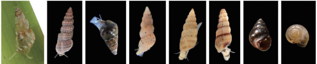
シマハマツボ (47) ノノメツボ (45) スズメハマツボ (46) チビスナモツボ (52) サナギモツボ (53) ツヤモツボ (54) ヨシダ (68) カハタレ (70) カワザンショウ カワザンショウ