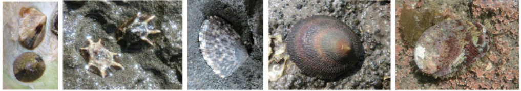
シボリガイ (12) ウノアシ (14) カモガイ (15) コウダカアオガイ (18) トコブシ (19)