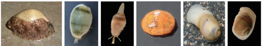
ハツコキダカラ (78) キイロダカラ (80) ザクロガイ (81) キシュウベッコウタマガイ (82) オリレシラタマ (86) ホウシュノタマ (87)