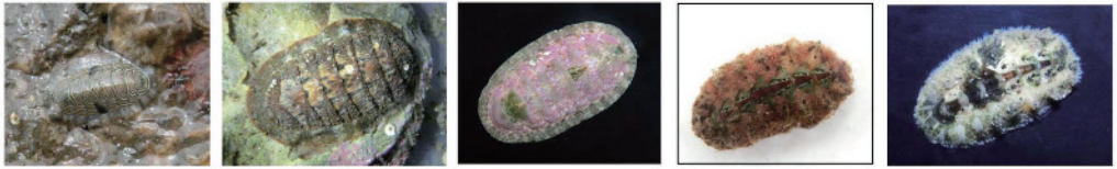
ウスヒザラガイ (2) ヤスリヒザラガイ (3) ニシキヒザラガイ (6) ヒトデヒザラガイ (7) ヒメケハダヒザラガイ (9)