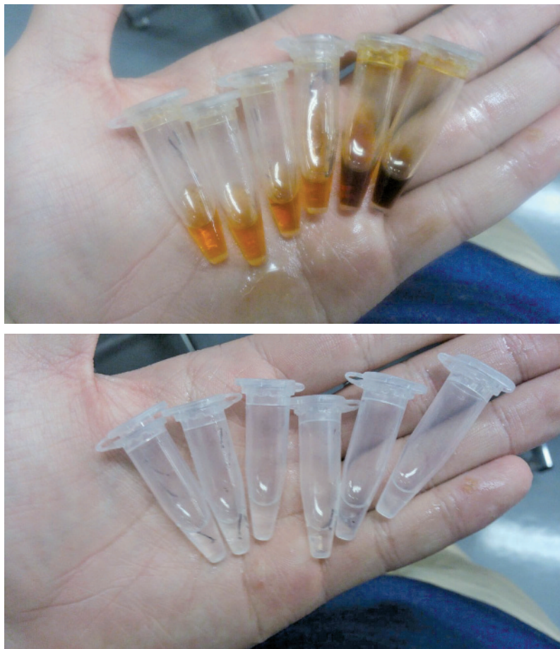
図1. 写真上は左から \alpha -リノレン酸の1, 8, 22, 48, 120, 240時間経過後の様子。 写真下は左からリノール酸の1, 8, 22, 48, 120, 240時間経過後の様子。