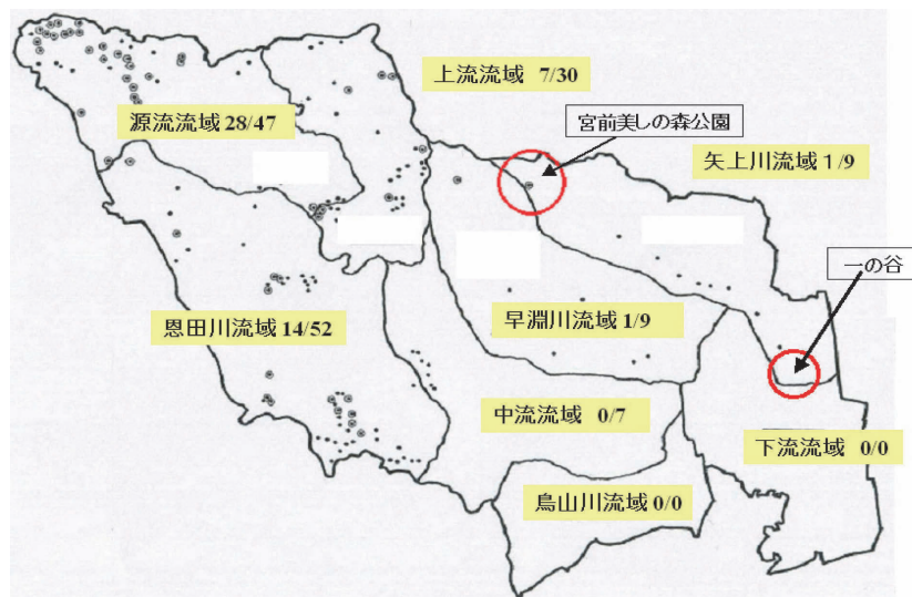
図1：鶴見川流域における亜流域別のホトケドジョウ生息状況 岸ほか(2002)の結果をまとめたもの。 A/B：B＝調査された小流域（谷戸）の数，A＝ホトケドジョウの発見された小流域の数。

この調査結果を受け、危機にある亜流域における本種の地域個体群の保護・回復策を検討した岸ならびに以下本稿に紹介される関係諸団体は、亜流域絶滅の危機にあった2つの流域のうち矢上川流域において、企業、行政、学校、市民団体等の連携を通し、域外保全地のネットワークを育てる方式によってホトケドジョウ地域個体群の絶滅回避の工夫を推進し、希望ある成果をあげることができた。以下は、その経緯と現状、ならびに未来にかかわる整理である。