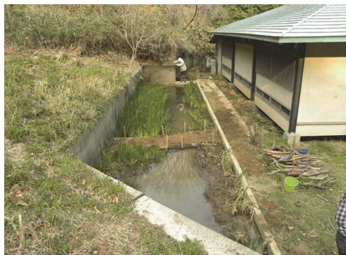
写真3：慶應義塾大学日吉キャンパスまむし谷・一の谷で整備されたホトケドジョウ域外保全のための半自然水域。竜の子たんぼビオトープ。