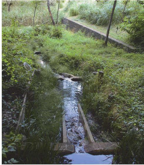
写真2：宮前美しの森公園に設置されているホトケドジョウ保護のための水路