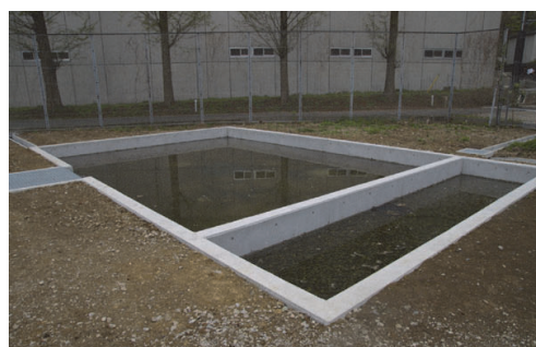
写真4：2012年3月、まむし谷に設置された雨水調整施設の機能もなう池のビオトープ。

水面の構造的な安定度をさらに高めるとともに、矢上川流域内において、谷戸の水域，学校ビオトープ等を活用することによって，さらに数箇所の安定した域外保全地を確保することであった。