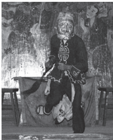
▲図版 31 跳魁星

29)。そして西王母の誕生日にこれを献上して長寿をことほぐ。西王母，東王公の見守るなかで，前日と同様，八仙が現れる（図版 30）。そして跳魁星（図版 31），加冠進禄の慶祝の演戯がくり返される。村人にとって，こうした祝福の演劇はくり返しみるべきものようである。