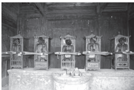
▲図版 27 広恵宮内に置かれた神像。左から郭榮佑夫妻、張謹の外甥、張八婆、張八公。

そして、午前10時半頃、英節廟に戻る。行きも帰りも爆竹で祝福される。神輿が英節廟に帰還し、廟内にはいる瞬間神輿の担ぎ手たちが勢いよく走り込む(図版28)。この光景は神がみの力を示すものなのだろう。興味深かった。また、祖神らがすべて安置されると、村の女性たちが神がみに向けて改めて祈りを捧げる(前掲図版16)。