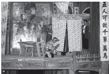
▲図版 37 母を求めての開洞は七回くり返される。