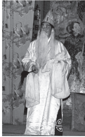
▲図版 23 太白仙翁が赤子を救う。