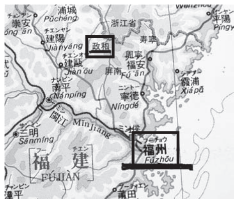
▲福建省政和県位置図

福建省政和県東南部 ヤンユエン 楊源村（省都福州の北約 300 キロ）では、毎年、春と秋の二回、 インジエミャオフウイ 英節廟会を催し、そのなかで古風な祭祀 スーピンシー 芸能四平戯を演じている。四平戯は名前だけは相応に知られているが、福建省の研究者のあいだでもまだ比較的調査研究が立ち遅れている。何よりも、近い過去にどこにどのていどの村落でこれがおこなわれていたのか、その伝承した芸能の内容や台本がどのようなものであったのかについて、基