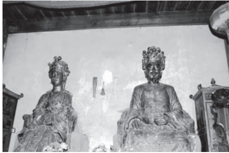
▲図版 6 張謹夫婦の像