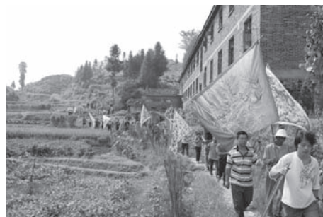
▲図版 14 広恵宮からの帰還