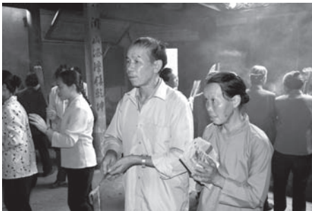
▲図版 55 個人の祈願に応じる陰陽先生。

いた。かつては正月十五日になると、遠近から参拝客と道士が集まり、政和県内では最も影響力のある祠廟のひとつであったという 28) 。