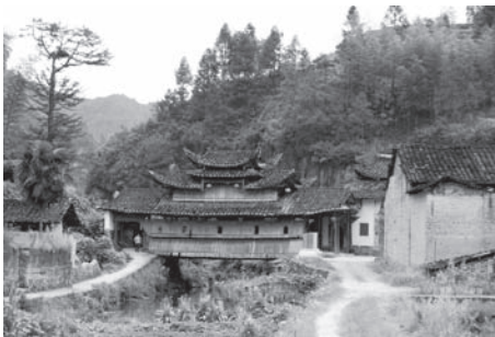
▲図版4 楊源村英節廟遠景。正面の家型のものは橋。この地方には多い。