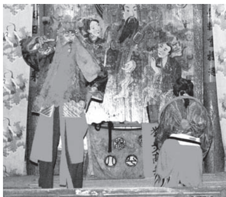
▲図版 34 兄の二郎神に咎められ首枷をはめられる妹の三仙娘。

劉沈香は八仙の一人である李鉄拐から力を授かり、母のいる黒風洞に向かう。途中、水林洞で二郎神や孫悟空と戦う（図版 36）。そして、李鉄拐の授けた火胡炉を用いて敵を下す。こののちに、劉沈香は母の救出を