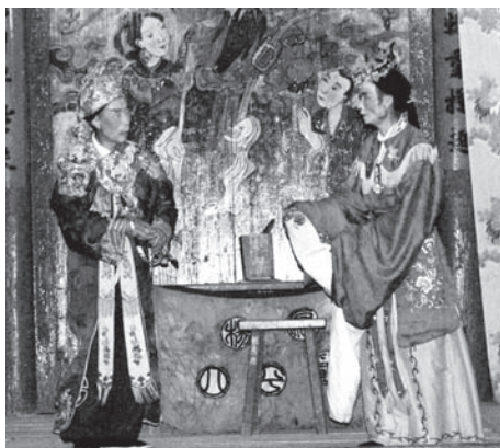
▲図版 25 石臼小屋での母と子の対面