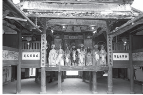
▲図版 7 英節廟内の舞台。