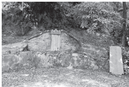
▲図版1 政和県鉄山鎮にある張謹の墓

楊源村の張姓は唐代に河南省から福建の閩県（現在の閩侯、福州の隣り）に移り住んだ。そして、黄巢の乱が起きた時、唐朝の招討使であった張謹は、現在の政和県鉄山の地で戦死した（887年あるいは878年 4) 。そのため張謹の墓は現在も鉄山鎮にある（図版1）。父親の死後、3人いた息子たちは閩県から政和県に居を移した。そのうち、