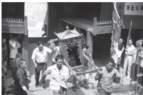
▲図版 28 神輿が廟内にはいる時は勢いよく駆け込む。