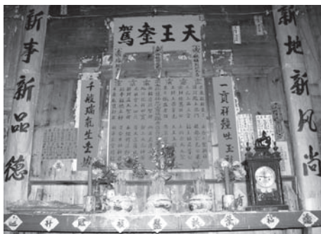
▲図版 45 桃洋村張氏宅の神堂。中央下は 戯神「天王」。

ちなみに、陰陽先生は還願の前提となる増福、延寿の祈願も担当する。また神の慶誕の儀の一環として傀儡戯を演じることもある。