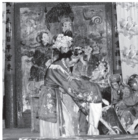
▲図版 26 母と息子の再会。女性たちにとって、最も期待される場面。

して二度目の対面から団円に至るところなどは宋元以来の目連戯の構図を踏まえているといえよう。