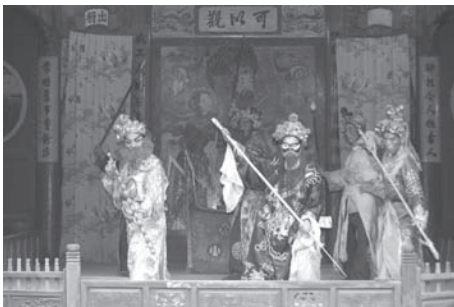
▲図版 20 姚江下山。姚江は王音らの意を受けいれ、従軍の決意をする。義が強調される。

李員外は馬面王廟にいて劉智遠に会う。そして劉智遠は見込まれて李三娘と結婚する（図版 21）。ところが、李員外が病死して、状況が変わる。劉智遠は李三娘の叔父の李洪