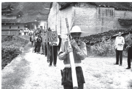
▲図版 10 迎翁会の人びとによる行列。