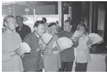
▲図版 16 行列が帰還したあと、婦人たちが恭しく拝礼する。