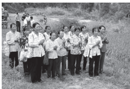
▲図版 50 参拝にきた婦人たち。こうした女性たちが廟や寺の復興を推し進めている。