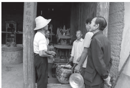
▲図版 13 広恵宮では演唱だけをする。