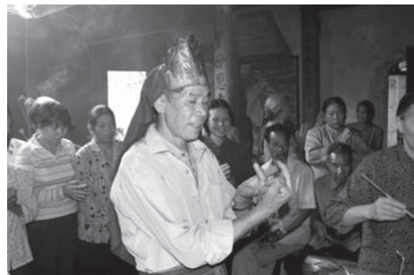
▲図版 54 閩山教の行儀、手印を結び厄除け。