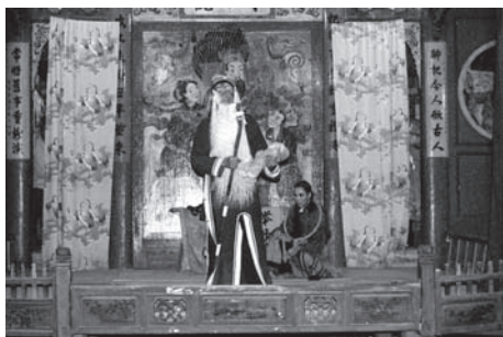
▲図版 35 赤子の沈香は土地神に助けられる。