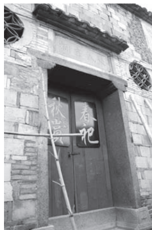
▲図版9 村内にある祠堂

一代で24人 張姓宗族には祠堂（図版9）の理事会が別にあるが、それを除くと迎翁会が最も重要な宗族組織といえる。迎翁会は五代が一組となって機能する。一代は村内を4グループ（房 フアン ）に分け、各房から6人ずつ、計24人の福首を選んで組織する。五代のうち、もっとも新しい代が祭儀の代表となる。そして、廟会のたびに新しい代が産み出されてくり上がっていく。つまり1年に2代が生じる。以前はすべて張姓の者が担ったが、近年は外姓の人も参加する 9) 。