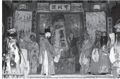
▲図版 19 加冠進禄などの慶祝の演戲

た息子が帰ってきて対面する。この一家では、その兄もまたすでに科挙に合格して喜びが重なる。すなわち聯芳（連なる喜び）である。慶祝の場面を演じるもので、明代のいわゆる「頌類」 26) 。