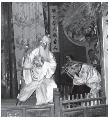
▲図版 29 東方朔偷桃。