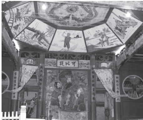
▲図版 8 廟内の舞台。賜福天官、金童・玉女の図がみえる。

廟内に設けられた舞台はなかなか趣がある。この舞台は元来、廟と同時に作られたとみられる。しかし、現在のものは道光30（1850）年に重建されたものである。舞台正面の壁には賜福天官、金童・玉女が大きくえがかれている。さらに天井にも八幅の人物画がみられる（図版8）。