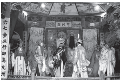
▲図版 30 西王母，東王公と八仙