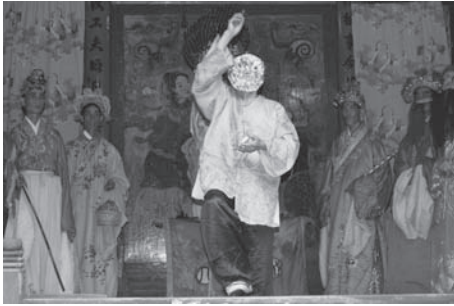
▲図版 18 魁星の跳舞