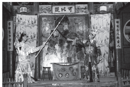
▲図版 43 玄武関。西遼の女将軍才月娥（左）は唐軍にとって強敵である。