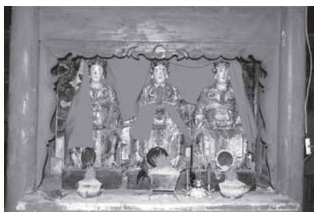
▲図版 49 右隣の部屋に安置された三夫人。