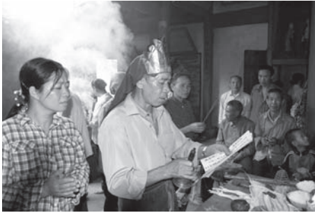
▲図版 51 陰陽先生が女性たちのために疏文を読み上げる。