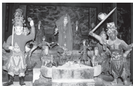
▲図版 48 鉄坑廟内、中央は陳靖姑。