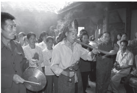
▲図版 53 陰陽先生による閩山教の行儀。神がみへ祭儀の挙行を通知する。