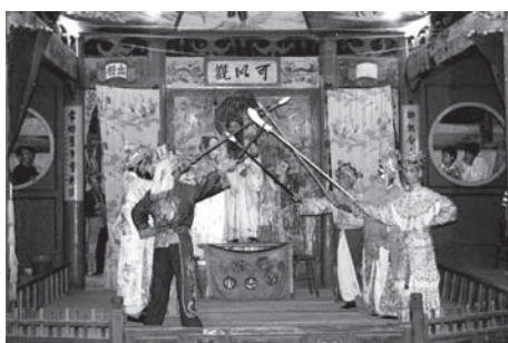
▲図版 44 唐軍の秦漢と西遼の才月娥は和平を結ぶ。

踏（仮面戯）のなかにも「鮑三娘・花関索」がある 27) 。これもやはり男女の勇者が大立ち回りを演じるものである。