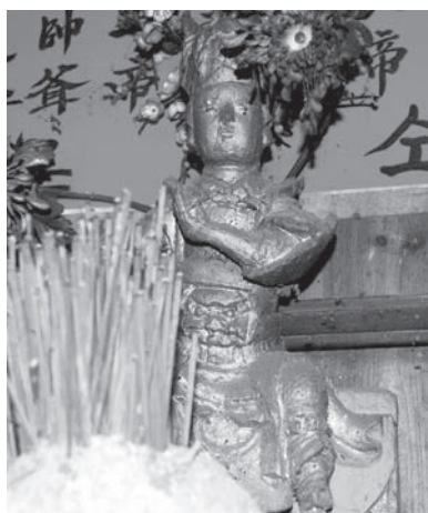
▲図版 46 天王