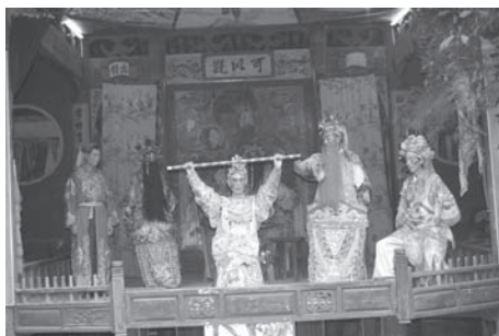
▲図版 32 楊宗保を救いにきた遼の女将穆桂英。この女将は後世の戯曲でも頻繁に登場する。