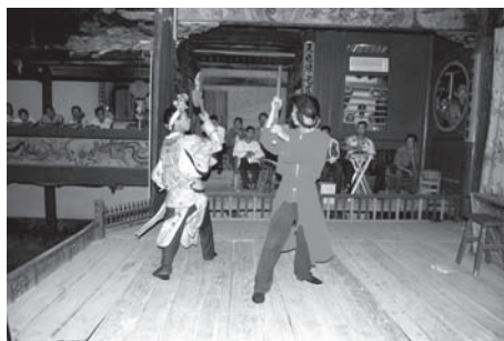
▲図版 36 劉沈香，孫悟空と戦う。