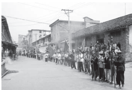
▲図版 15 村内をいくとき猛烈な爆竹の歓迎を受ける。