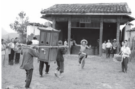
▲図版 12 広恵宮に到着した神輿を迎える。

これは張謹の出戦のさまを模したものだという。また、広恵宮のなかの神像の前で四平戯の一部を演唱する（ここでは演戯はおこなわない）（図版 13）。広恵宮は英節廟に付属する小廟である。神輿の臨時のお旅所 たびしょ のような施設である。なかには何もない。ここからの帰りは、旌旗が先頭に立ち、そのあとから神銃などが従う（図版 14）（図版 15）。迎翁会の一団は五代のメンバーが全員参加するので、なかなか盛大である。