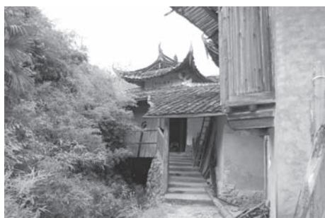
▲図版 47 鉄坑廟（臨水宮）は三女神をまつる。周囲に民家はない。現在、復興の気運がある。

鉄坑廟（別称、臨水宮）は福州閩山派道教のまつる陳靖姑の義妹「李三夫人」、俗称「李大奶」をまつっている（図版47）。建物の概観は現在、少し朽ちた状態である。だいぶ長いこと祭祀がおこなわれていなかったことをものがたる。なかにはいると、中央の室内に臨水夫人と通称される三夫人（左李三娘、中央陳靖姑、右林九娘）がまつられている。またその右隣の部屋にも三夫人がまつられている（図版48）（図版49）。鉄坑廟は福建東北部で広くまつられる李夫人の祖廟といわれていて、かつてはさかんに祭祀をおこなって