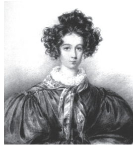
4. G. Sand par Musset