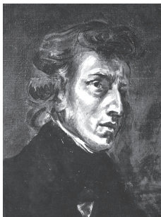
5. F. Chopin par Delacroix