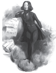
2. G. Sand en redingote