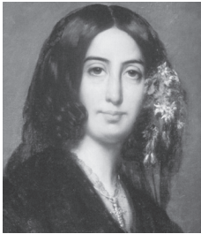
3. G. Sand par A. Charpentier (1838)