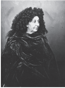
1. G. Sand avec la perruque de Louis XIV (Nadar, 1870)