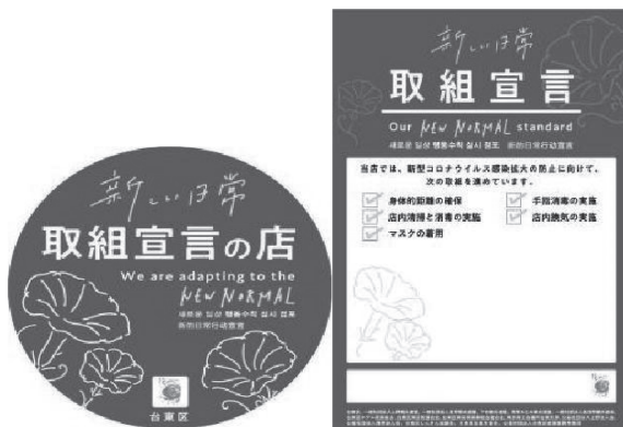
図表 17 特別区における独自ステッカーを通じた新型コロナウイルス感染拡大防止対策の取り組み比較