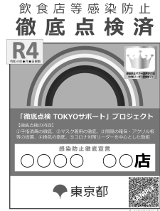
図表 4 感染防止徹底宣言ステッカー(徹底点検済)③