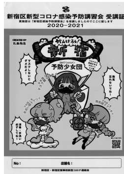
図表 10 新宿区 新型コロナ感染予防対策ステッカー