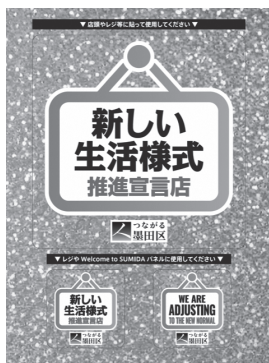
図表 15 墨田区新型コロナウイルス感染予防対策ステッカー