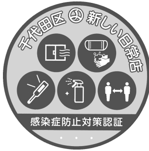
図表 13 千代田区新型コロナウイルス感染予防対策ステッカー (Class I)