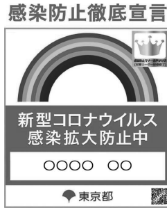
図表 3 感染防止徹底宣言ステッカー②