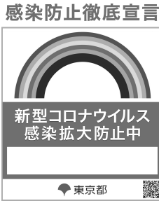
図表 2 感染防止徹底宣言ステッカー①