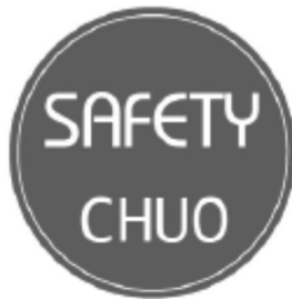
図表 12 中央区新型コロナ感染予防対策ステッカー