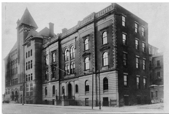
図1 Brooklyn Collegiate and Polytechnic Institute