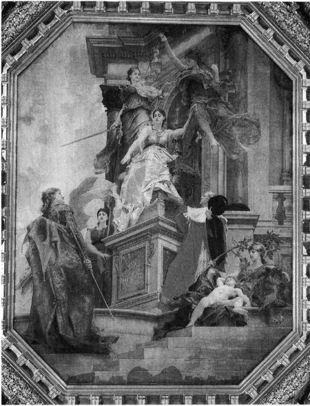
図1 ポール・ボドウリー 「法律の讃美」(1879年下絵完成)

う二人の女性像)ばかりでなく、法律(中央の台座に座す女性像)や判例(左下方に「法律」を見上げ背をこちらに向ける女性像)も擬人化し、その傍らに脱帽して法律に敬意を表す破毀院長の像を描き込んだ (4) 。西洋にはイコノグラフィックな法象徴研究が豊饒な地平を成している所以である。