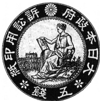
図4 エドアルド・キヨツソーネ 考案「明治17年民事訴訟 用印紙」

種印紙が「収入印紙」に統合されるまでユステイティアの印紙は用いられていた (52) 。