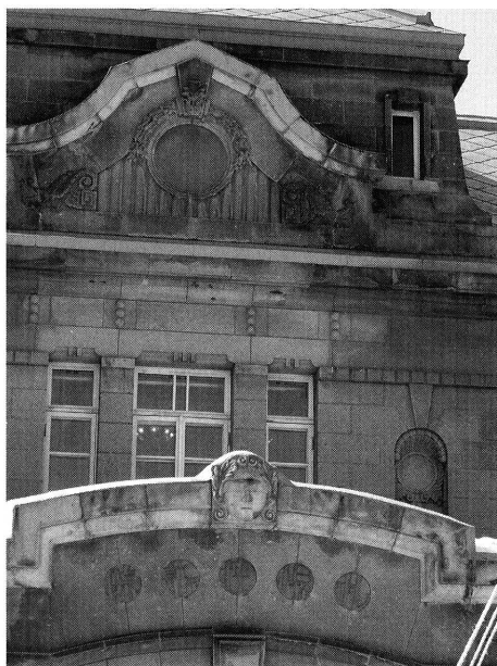
図5 「旧札幌控訴院（現札幌市資料館）正面」 下方の目隠しされたユスティティアの顔 とその上方の戦後菊花紋を削り落として できた円形の痕跡

この点で、明治三五（一九〇二）年にフランスの知日派画家フェリックス・レガメ (64) によって描かれたカリカチュアは意味深長である（図6）。左下の法服を纏い法典を差し出しつつ深々と礼をしている男は他ならぬボアソナードである。その相手は天の岩戸から現れた天照大神である。アマテラスは、自分は太陽神として世を照らす「貴方は西洋法の学識の光りで若い日本の法律家を照ら（啓蒙）してくれ」とボアソナードに頼んでいる。この絵では、アマテラスはユスティティアと画像的に等価の位置関係にあるが、法や正義の象徴という意味までは付与されていない。むしろ日出ずる国を象徴する神話的な光を放つアマテラスと、学識豊かな法学者を従えた西洋の法神とが睦まじく相和す様が描かれている。近代期日本では法をテーマにしたイメージの中で、ユスティティアと日本神話は共棲し得たのである。