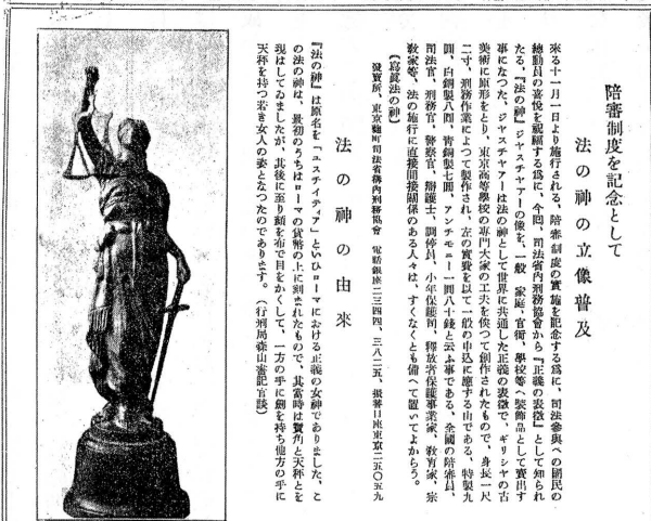
図7 陪審制度記念 ユスティチア・ブロンズ像

ンズ像は刑務作業として受刑者がその製造に「驚く程真面目に」勤しむことが報告され、通信販売によつて「樺太台湾朝鮮満州支那南洋」を含む大日本帝国全土に遍くこの法の神が送り届けられた。 (69) ここで特筆すべきは、当時「正義公平」のイメージ化において、その範型がまず我が国固有の伝統の中に探し求められたという事実であろう。にもかかわらず西洋の法の女神が持ち出されざるを得なかつたのは、我が国に適当な表象が見つからなかつたからだが、その際もユスティチアが今や「世界共通の象徴」であることが強調され、その西洋起源性が極力相対化される (70) 。それにユスティチアを床の間や神棚に祀ることが奨励されたことは、 (71) 西洋の法神の登場も当時の日本で崇敬される古来の神々の列に新たに加わつたほどの意識であつたのかもしれない。この時、全国に流布したユスティチアの彫像を今も保管する裁判所や法学部が各地にあると聞くが、昭和一八年に停止を余儀なくされた日本の陪審制の記憶がそこには漂っている。