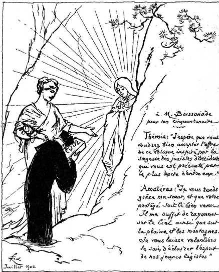
図6 フェリックス・レガメ 「ボアソナード氏の（博士号授与）50年を記念して」

テミス：西洋の法律家の英知より成った法典を、彼らのうちでも最も博識なこの者を介して捧げます。どうかお受け取り下さい。