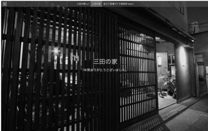
写真 10 三田の家 HP のフロントページ（2024 年から一般社団法人三田の家に衣替え）