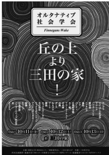
写真 11 オルタナティブ社会学会 2013 年日本社会学会大会（慶應義塾大学）と同時並行で実施