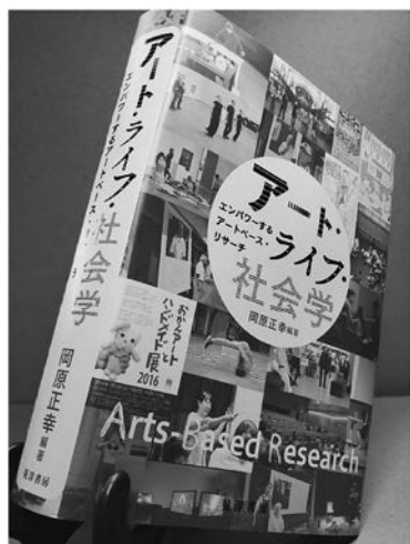
写真1 『アート・ライフ・社会学』