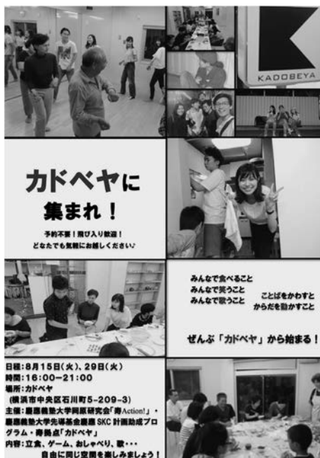
写真 13 Kotobuki action

そして、三田の家では2008年から5年間継続して採択され(合計1,200万円)、SKCでは2017年より3年連続で採択され(合計600万円)ました。義塾への恩義は忘れられません。というか、塾生がスパークするための基金でしたので、目論見通りの支出を行なわせていただいたと豪語します笑