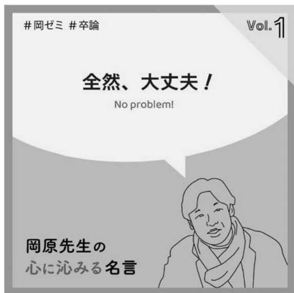
写真 17 インスタ岡ゼミ会 ( https://www.instagram.com/okahara_185804/ )