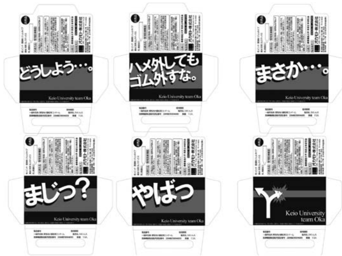
写真5 K-dom パッケージデザイン Ver.2