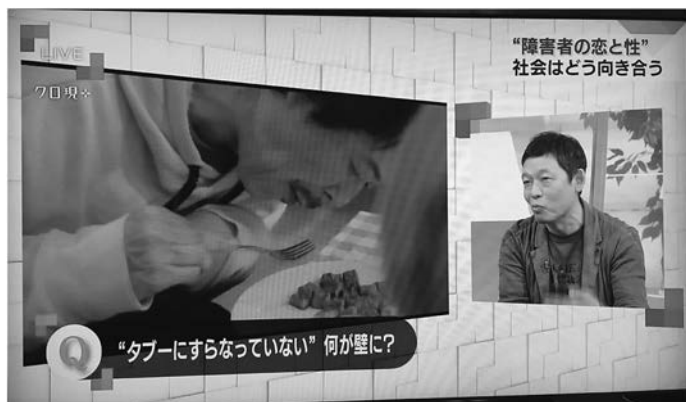
写真4 NHK クローズアップ現代+ 特集「障害者の恋と性」

言うまでもなく、慶應 × コンドームの K-dom です。2003 年と 2009 年に別途に行った企画で、個装コンドームのパッケージを学生がデザインし、販売、配布を行いました。2003 年のテーマはセクシュアル・マイノリティと HIV で、当時都内 HIV 治療の拠点だった都立駒込病院の医療スタッフを招いての学習会ののち、三種類のデザインで 3,000 個の K-dom が製作され、三田祭で約 2,000 個を販売しました。2009 年は、学生は身近で起きた予期せぬ妊娠をテーマにして、学内で質問紙調査を実施し、予想外の数で、予期せぬ妊娠と中絶を塾生が経験していることへの問題提起として 9 種類のデザインが作成されました。こちらは企業の協力で 10,000 個が無償で製作され、関連イベントなどでの無料配布を継続して行うことになりました。