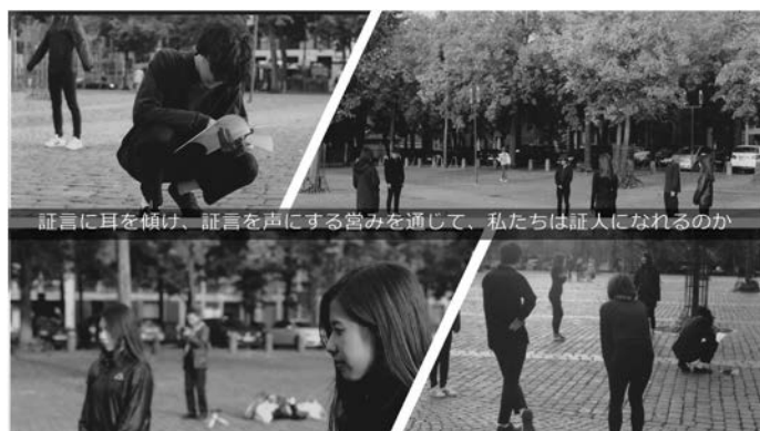
写真8 H/F ドイツ・ツアー ハイスありな作によるポスター発表（カルチュラルタイフーン 2019）

あるゼミ生の「太平洋戦争アーカイブズ」という試みもそのテーマに繋がります。土屋大輔君は、慶應義塾の戦没者遺族の聞き取りをする中で、岡原ゼミでは馴染みのTシャツに戦没者の氏名を記入し、その50着のT