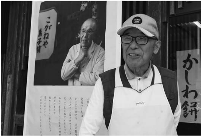
写真 12 牛久暖簾プロジェクト、こがねや店主

寿町にて夜のパトロール（食料品、衣料品などの配布ボランティア）に隔週で参加し、夏のお盆時期には、日吉教養センターが寿町に立ち上げた「かどべや」にて、地域住民を集めての一芸発表と懇親の会を開催しました。寿町という場に肩肘張らずに入り込む塾生を見て頼もしく思ったものですが、イベントのプロデュースはアートプロジェクトとして十二分な ABR 実践になることも確認しました。