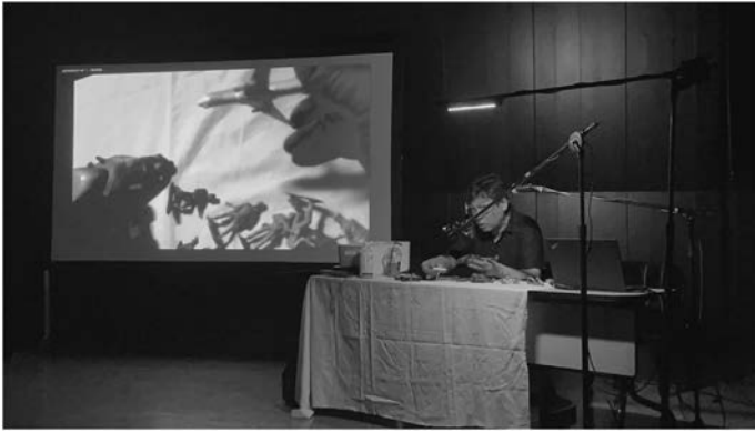
写真7 Art/Research/Practice 東京藝術大学主催シンポジウムでのレクチャー・パフォーマンス

示・慶應義塾大学文学部岡原研究会」というパフォーマンス、つまりギャラリー内でゼミを上演する（行う）というものにアカデミズム批判の点では近いのですが、来場者に最低賃金で慶應名誉教授を雇ってもらい、購入者が指示する行為を名誉教授すなわち私が行うものです。