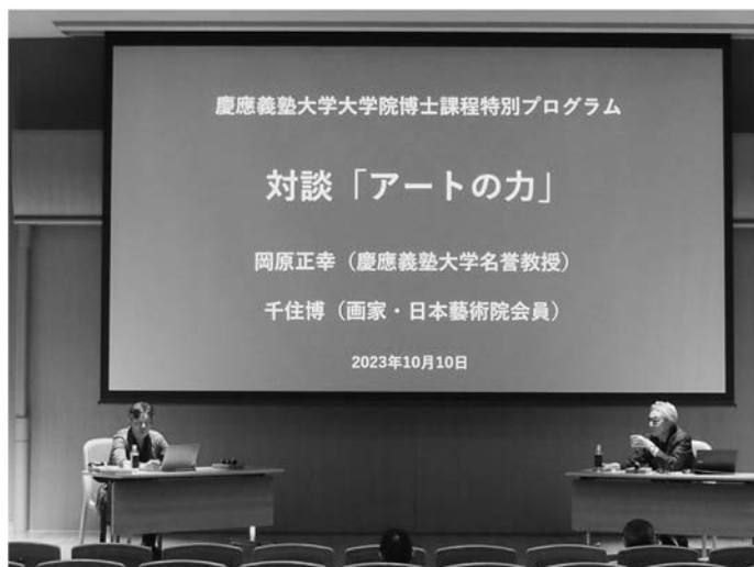
写真 14 Keio Spring コアプログラム Art/Design/Communication での中学同級生・千住博氏との対談

も、そんな提案に面白いじゃないかと言ってくれる他の研究科委員長や塾執行部があつてのプランです。新しいものへの「好奇心に基づくゆるさ」が塾の文化ですね、福澤先生！ https://doctoral-support.keio.ac.jp/spring/