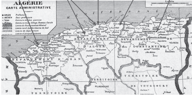
図1: フランス領アルジェリアの師範学校

男性師範学校: 1878-1962 女性師範学校: 1908-1962: El Kantara