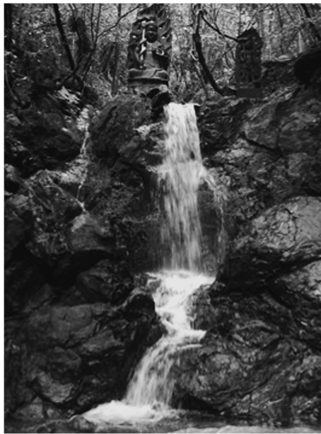
図4 第12番札所・千鶴ヶ滝

て修行した後に御堂を立てた。智山の修験の行者姿の像が境内にある。虚空蔵菩薩を本尊にする。千鶴寺では石鎚山信仰が強く、「千鶴ヶ滝」に入る行者は、主には石鎚山行者であった。現在でも4月と11月の第一日曜に行う大きな柴燈護摩の時には、石槌山の行者が参加する。石槌権現のご神体による身体