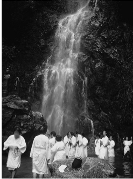
図6 佐賀県小城町清水観音での滝修行