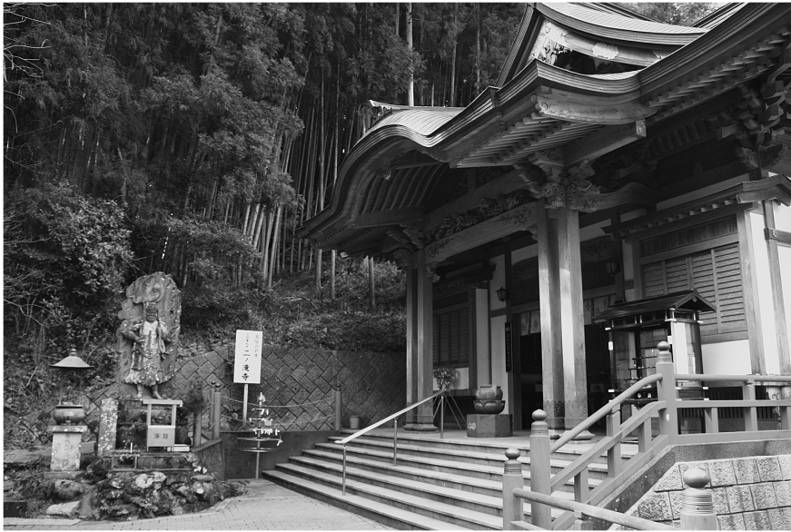
図5 第14番札所・二ノ滝寺

の滝と神代の滝など山奥の滝もあり、行場であつたらしいが、現在では使用されていない。