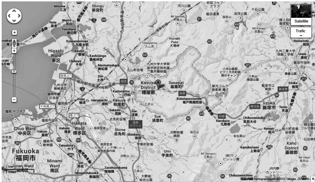
図1 福岡県糟屋郡篠栗町の位置

「遍路体験」などの新しい活動が始まり、現代の修験道に顕著な「体験修行」[長谷部2011]とも共通する様相がある。近年になって篠栗の霊場を巡る大きな遍路団体や講集団は少なくなったが、新しいタイプの遍路や行者が生まれて篠栗に向かう。篠栗では多様性を基盤に、時代の移り行きと共に、遍路や修行の意味が急速に変化してきた。本稿では篠栗の現代の修行活動を通して、宗教性を再考する。