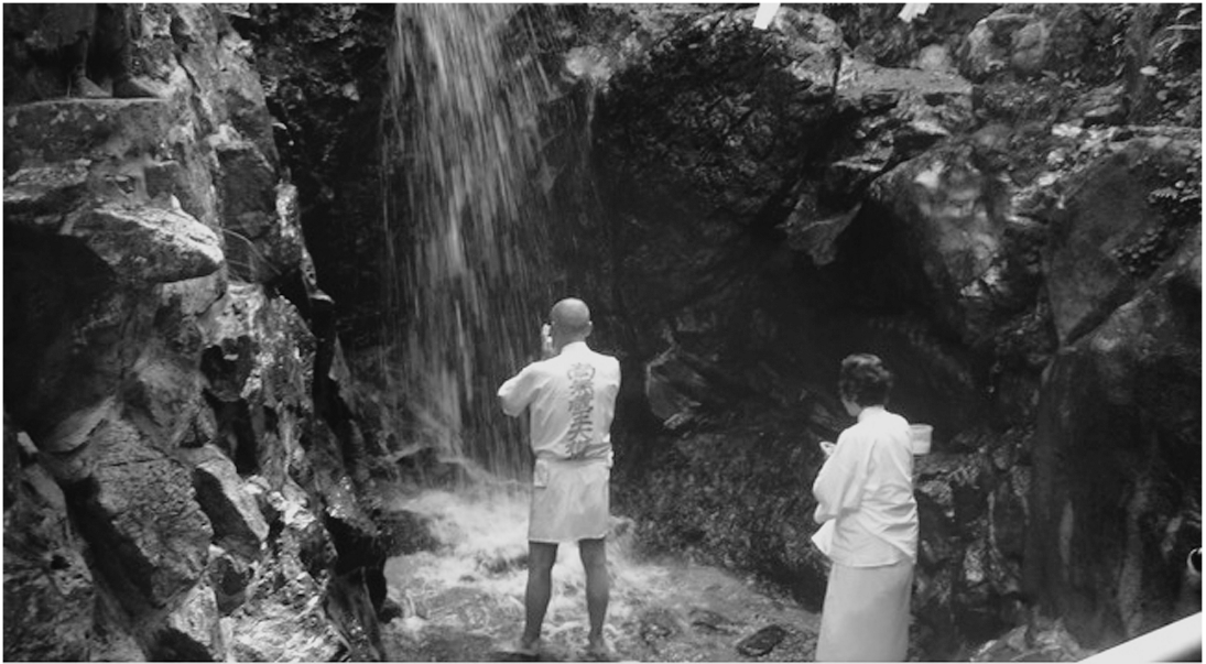
図3 若杉山明王院の養老の滝での修行者