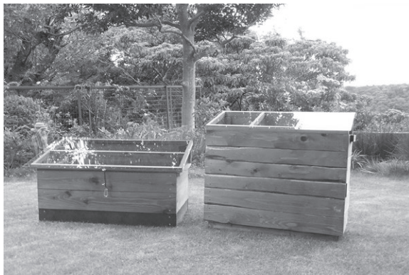
バクテリア de キエーロ (左) とベランダ de キエーロ (右)