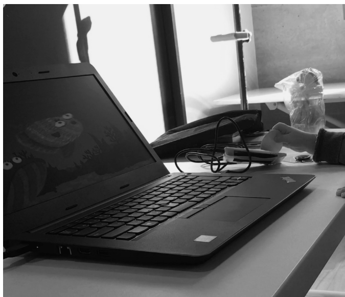
図5 RFIDタグを持ってインタラクティブなデジタルアートをPCで使用

製作には1ヶ月ほど要し、2回の患児の使用と医療スタッフの評価を元に改善を行い、使用可能となっている。