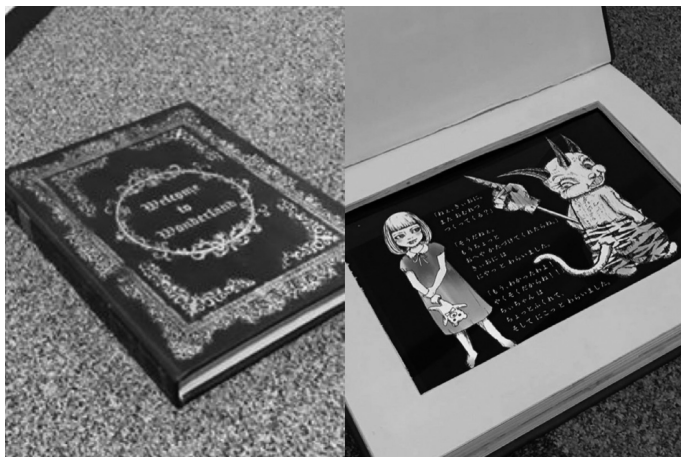
図4 遠隔での読み聞かせ絵本