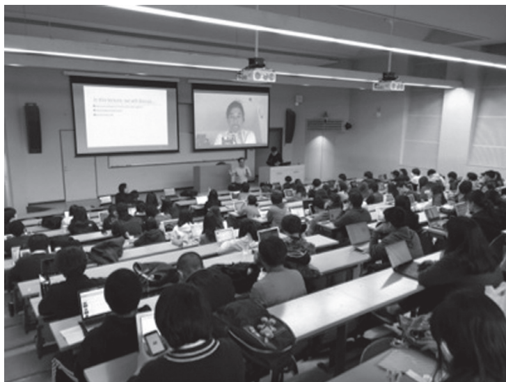
図3 遠隔授業での利用例

上記以外においても、キャンパス全体で教室へのSPAM通話がなくなったこと、セキュリティ面でも外部からテレビ会議システムへの直接アクセスが遮断されたことにより不正アクセスや機器が攻撃を受けるリスクが軽減され