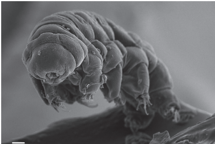
Fig. 1 ヨコヅナクマムシの電子顕微鏡写真。スケールバーは10 \mu\text{m} 。

クマムシについての研究では、長年にわたり野生の個体を用いて生理学的な実験を行うことが慣習となっていた。クマムシを研究対象とする科学者の