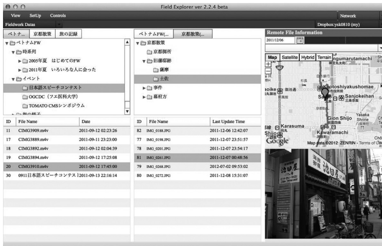
図 3 クラウドサービスを介したデータ共有の画面

この実験の目的は、ノート PC 版 Field Explorer の利用状況への観察を通じて、その利便性と利用者へもたらしている具体的な効果を把握することである。実験は、7 人の学生を対象に 2011 年 8 月ならびに 12 月に行い、また