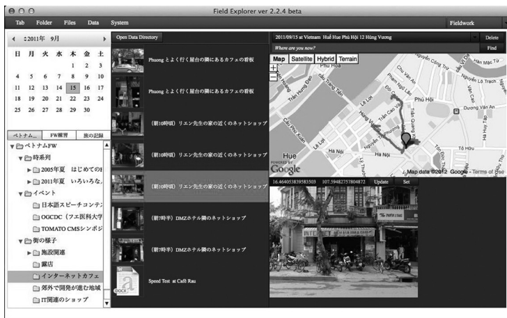
図2 時間的・位置的な関連性をもとに記録を表示するインターフェイス

図2は、ノート PC 版 Field Explorer の画面である。カレンダー、地図、階層化したキーワード群、対応する記録を表示する部分、写真や映像などのプレビューを表示する部分、以上の各部を同一画面上に配置している。これにより、たとえばカレンダーの日付をマウスでクリックすれば、その日に採取した記録が時系列で媒体の区別無くリストアップされ、地図上には記録を採取した場所が表示される。このとき GPS ロガーを使用していれば、あわせてどこをどう歩いたのかという動線を把握することが可能となる。また、個々の記録を選択すれば、その記録を採取した日時がカレンダー上に表示され、同時に地図上にはその記録を採取した場所が表示され、写真や映像であれば