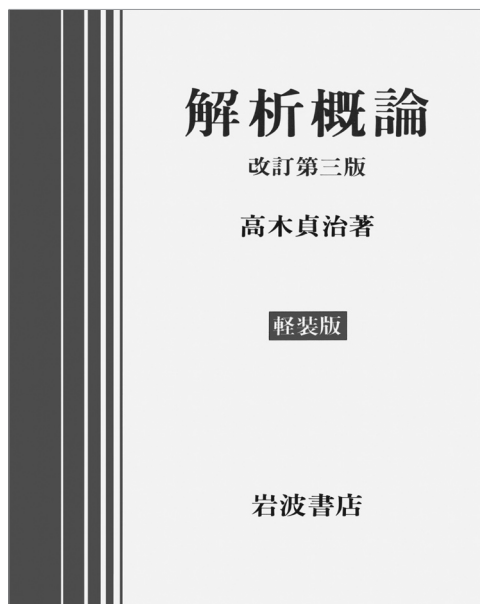
図2 高木貞治「解析概論」

共立出版より「スミルノフ高等数学教程全5巻」として出版されている。監修は彌永昌吉・福原満洲雄・河田敬義・三村征雄・菅原正夫・吉田耕作である。現在は分冊を整理して12巻として出版されており、その内容は