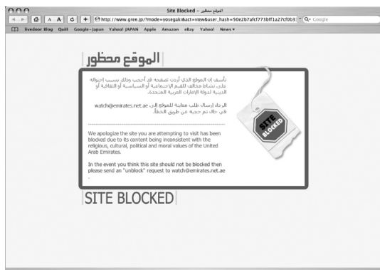
写真2 UAEにおけるサイトブロック表示画面

「禁制:あなたのアクセスは、アクセスコントロールリストによって拒否されました」というメッセージのみが表示される。