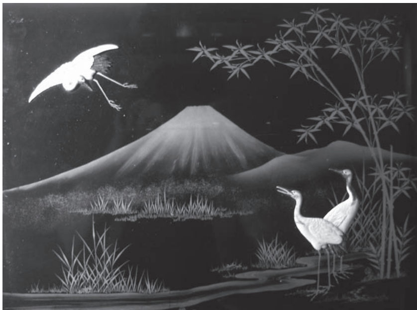
Photographie 1 Couverture laquée d'un album de 50 photographies-souvenirs du Japon (18..?)